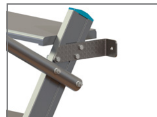
Fixation au mur en option