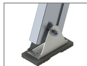
Sabot articulé en option