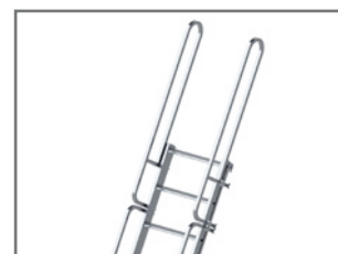
Rampe de sortie en option