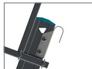
Crochet en option