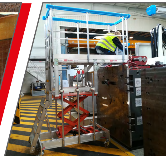
Mantenimiento en el sector industrial