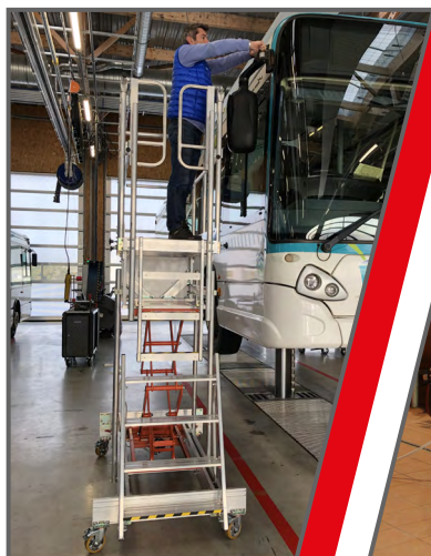
Mantenimiento en el sector del transporte