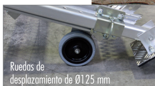
Ruedas de desplazamiento de Ø125 mm.