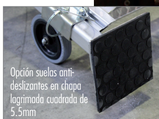
Opción suelas anti-deslizantes en chapa lagrimada cuadrada de 5,5mm